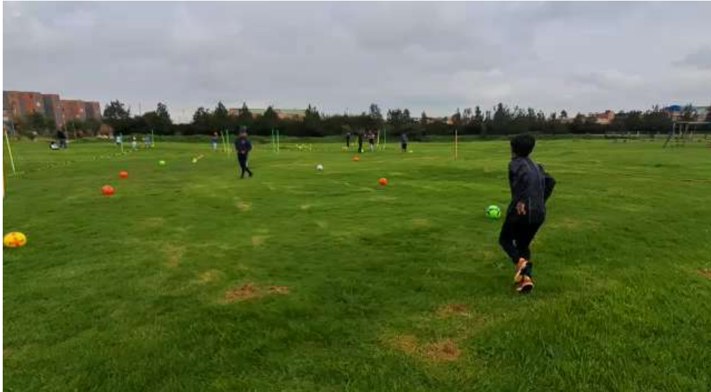
Video: Entrenamientos de arqueros