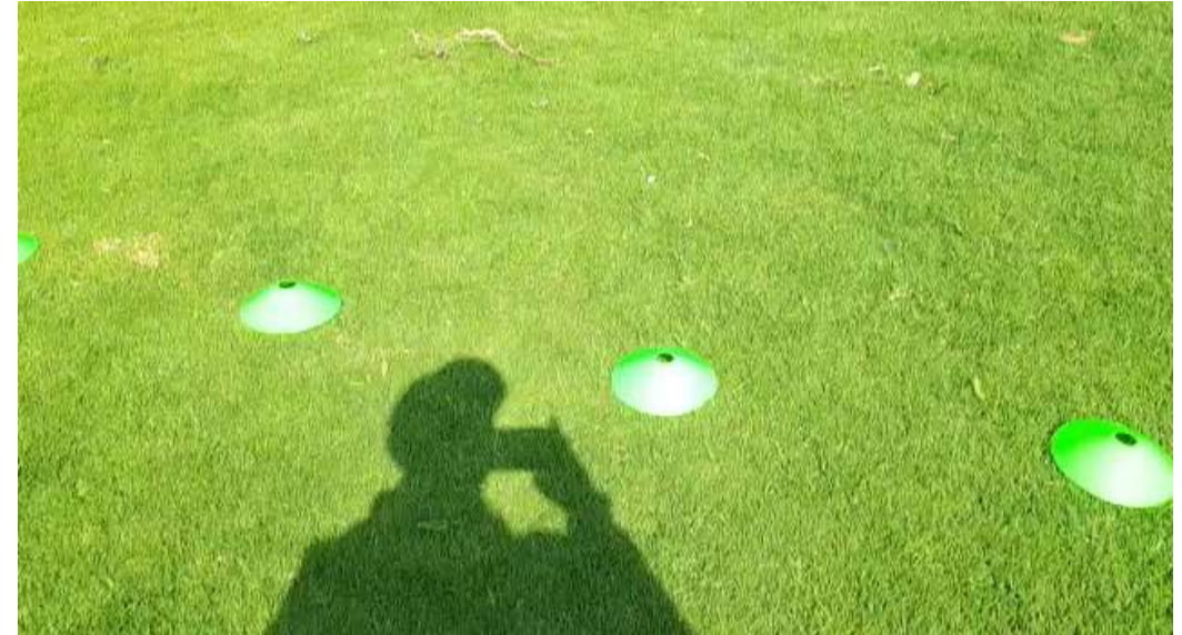
Video: Entrenamientos categoría